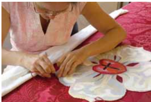
Dronning Margrethes antependium.