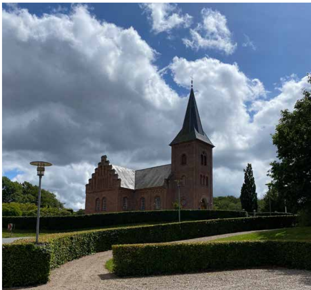
Sommer ved Padesø kirke